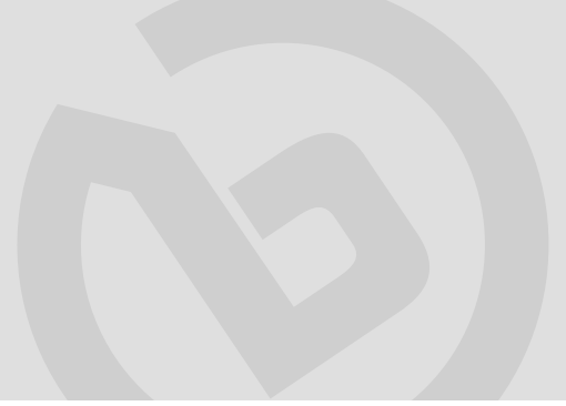
DÖNER ARABALI FIRIN (MAX,MID)